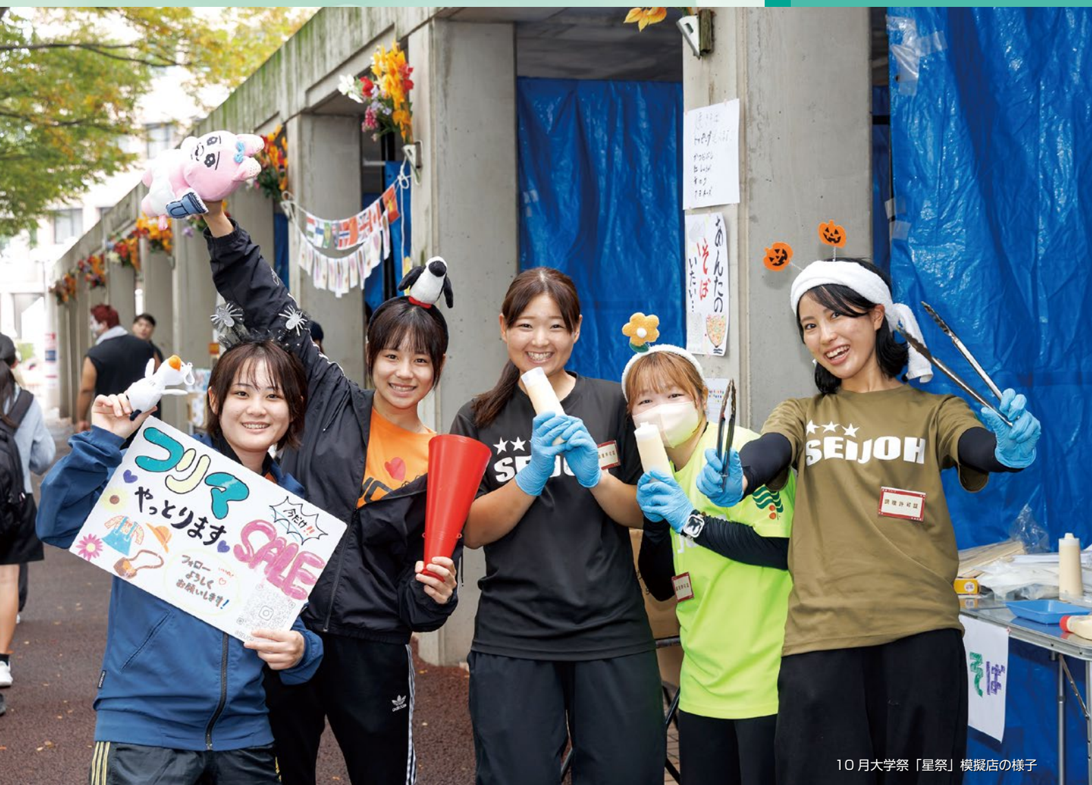
10月大学祭「星祭」模擬店の様子