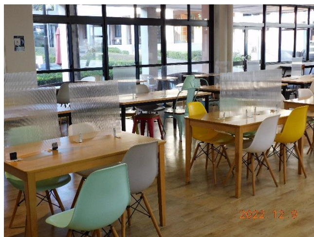
カフェテリア・アクリル板衝立