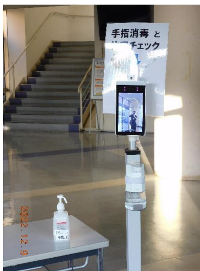
3号館1階・入口(検温)