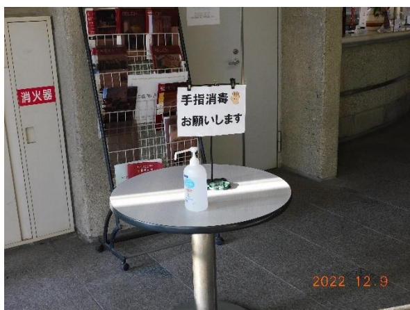
本館1階・入口(手指消毒)