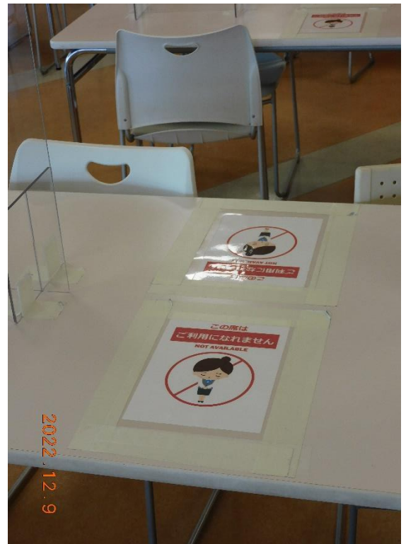
学食・「着席不可」注意書き