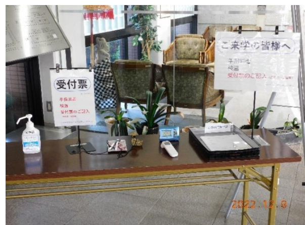
本館1階・来客受付(手指消毒・検温)