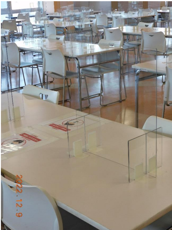
学食・アクリル板衝立