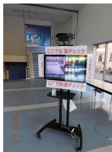
4号館1階・入口(検温)