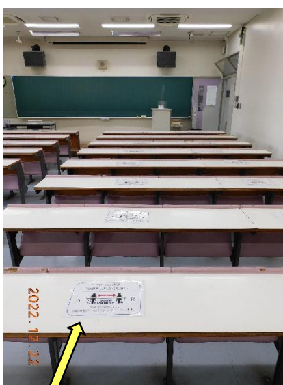
2号館教室・着席不可 注意書き