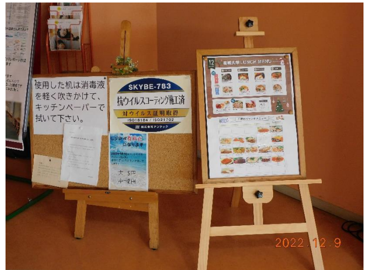
同左(抗ウイルスコーティング施行済)