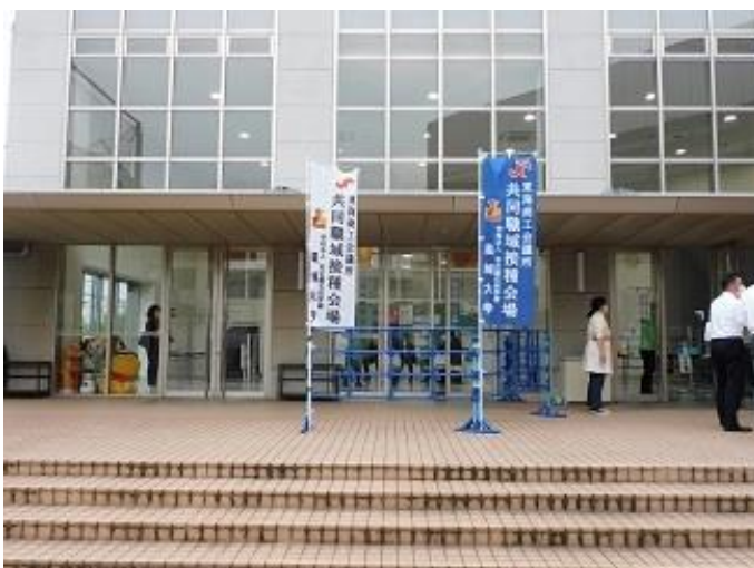
共同職域接種会場(4号館)入口