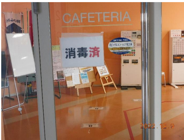
学食(4号館2階)入口(毎日、オゾン消毒を実施)