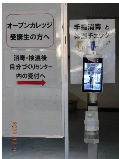
本館1階・入口(検温)