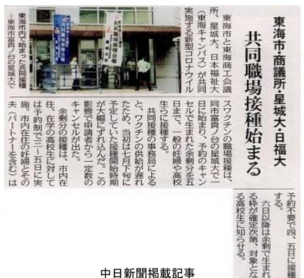
中日新聞掲載記事